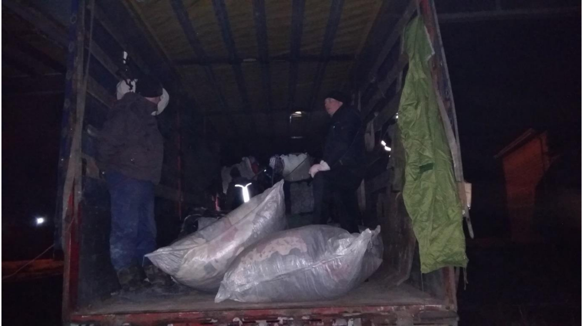
Ukk partneri ladu Novomoskovskis