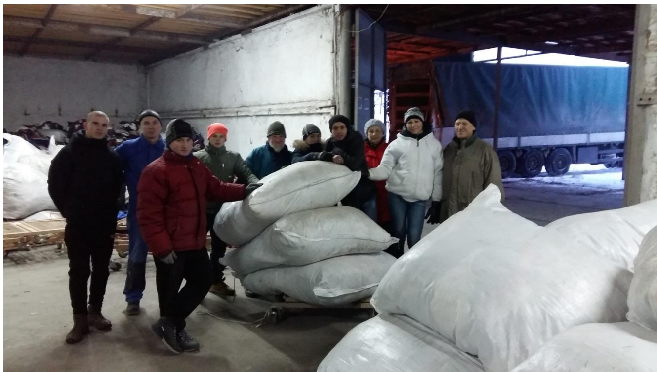
Humanitaarabi laialijagamine meie koostööpartnerite poolt, Novomoskovski ladus