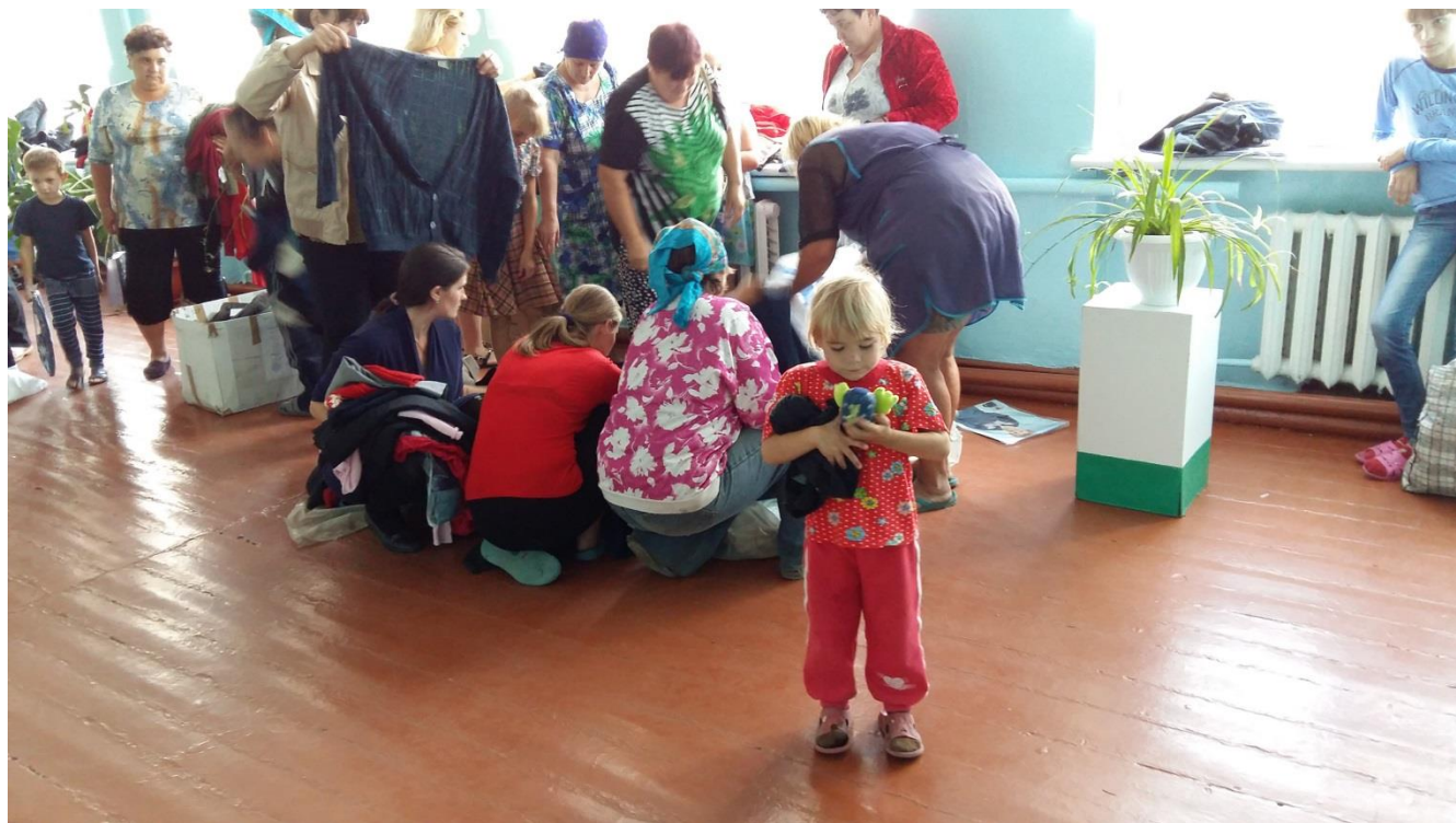
Verhovtseva lastekodu lapsed saadud abiga.